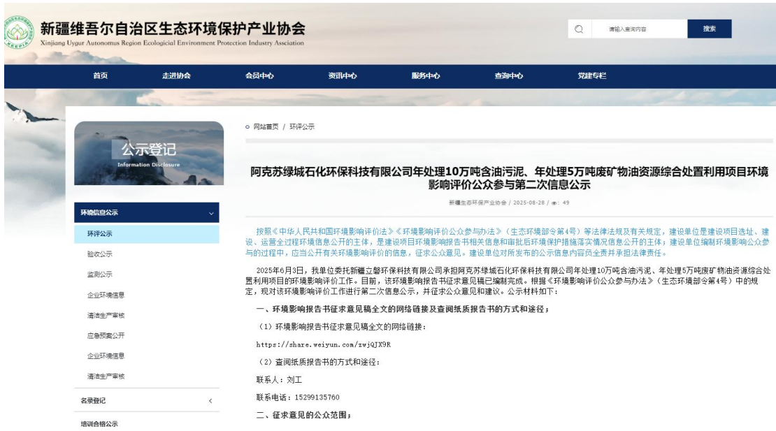
图2 本项目征求意见稿网络公示截图