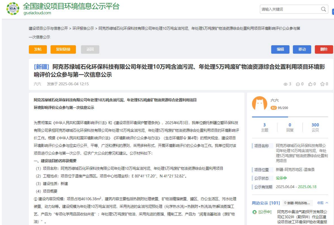
图 1 本项目第一次网络公示截图